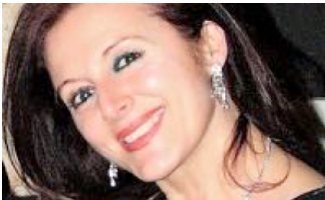
Paola Fornasari regista

Mezzosoprano di livello internazionale debutta nel 1985 a Spoleto nell'opera "Orfeo ed Euridice" di Gluck e da allora inizia una carriera durata 25 anni che l'ha vista impegnata per più di 80 produzioni operistiche e teatrali, accanto ai più grandi cantanti, registi e direttori d'orchestra e nei più importanti Teatri Italiani.